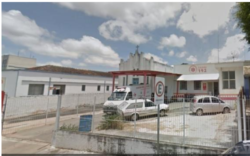
SAMU – SERVIÇO DE ATENDIMENTO MÓVEL DE URGÊNCIA