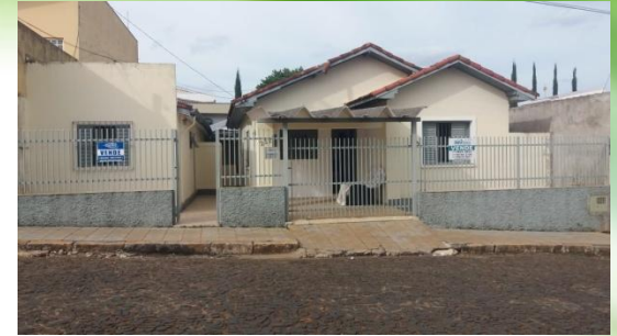
RESIDÊNCIA TERAPÊUTICA FEMININA