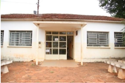
POSTO DE SAÚDE DO CERRADO