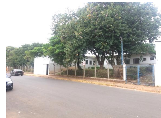
ESF VILA SANTA TEREZINHA