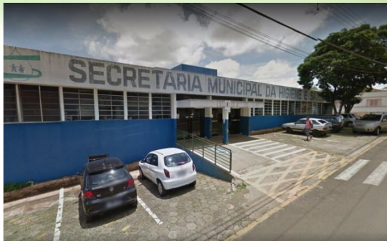
SECRETARIA DA SAÚDE, CVET; CENTRAL DE REGULAÇÃO; AÇÕES COLETIVAS; CENTRO ODONTOLÓGICO.