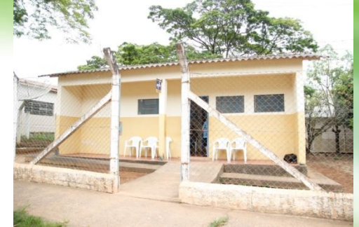
POSTO DE SAÚDE DA PEDRA BRANCA