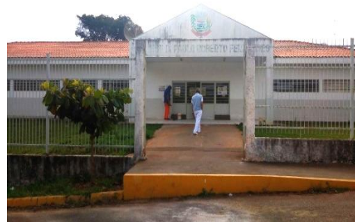
ESF BAIRRO DO CRUZEIRO