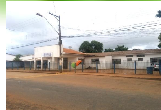
ESF VILA TONICO ADOLFO