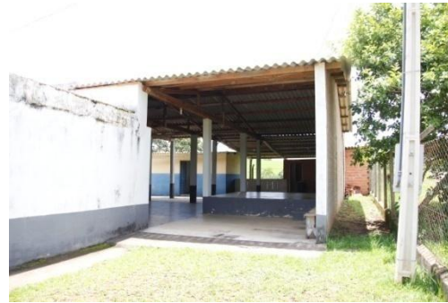
POSTO DE SAÚDE DA SERRINHA