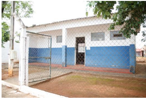
POSTO DE SAÚDE DA SANTA CRUZ DOS LOPES