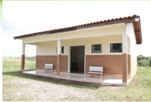
POSTO DE SAÚDE DO MATÃO