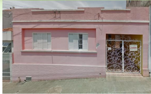
RESIDÊNCIA TERAPÊUTICA MASCULINA