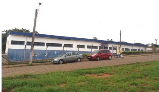
ESF JARDIM ALVORADA