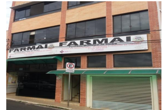
FARMÁCIA MUNICIPAL DE ITARARÉ