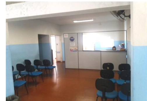
UBS II CENTRAL/SAÚDE MENTAL