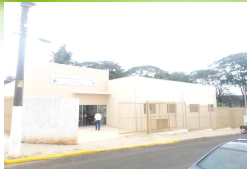
UNIDADE DE SAÚDE VILA OSÓRIO