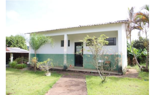
POSTO DE SAÚDE DA SANTA BARBARA