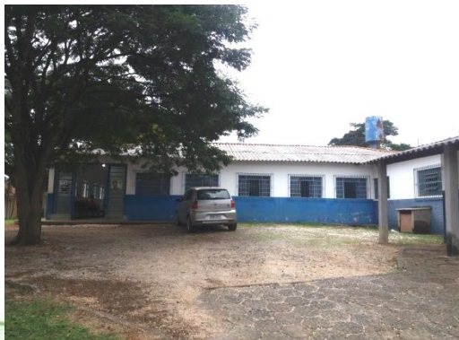
ESF VILA NOVO HORIZONTE