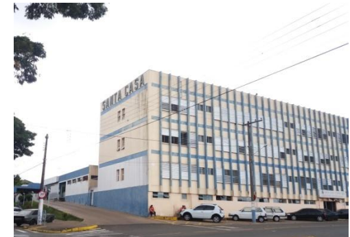
SANTA CASA/AMBULATÓRIO DE ESPECIALIDADE