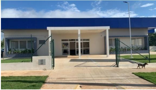
CENTRO DE ATENÇÃO PSICOSSOCIAL