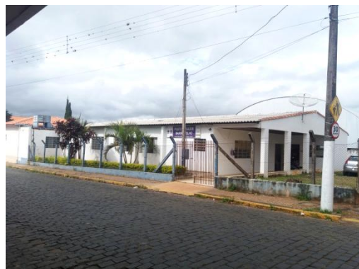
ESF BAIRRO VELHO