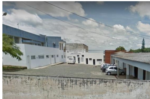
UNIDADE DE CONTROLE DE ZOOSE